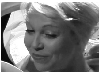
Anne Zeiher : Soprano

Elle est considérée comme l'une des meilleures sopranos actuelles. La combinaison de son timbre de voix magnifique et de l'intensité dramatique de son jeu de scène fait d'elle une très grande interprète de l'opéra